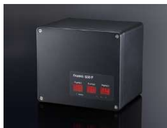
PAMAS S50 P con bomba integrada para aplicaciones de sistemas sin presión.

Para aplicaciones sin presión, el PAMAS S50 puede ser equipado con una bomba adicional ( PAMAS S50 P ). Dicha resistente bomba de pistón cerámica controla el flujo a 25 ml/min en un rango de presiones de 0 a 6 bar.